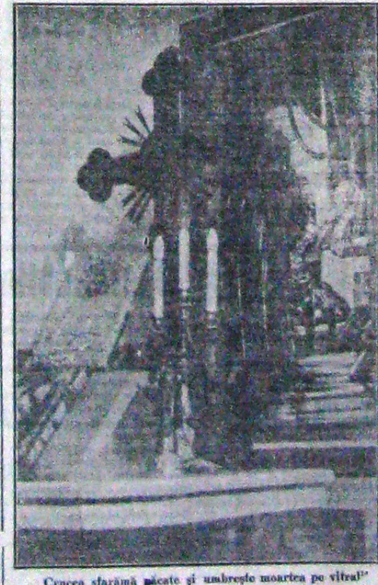
Crucea stărnă păcate și umbrește moartea pe vișul